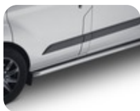
ARP* Turvatanko sivulle Putkimalli taivutetuilla kulmilla kiillotettua ruostumatonta terästä