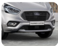
Etuilmanohjain sarja, maalattu hopea