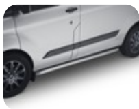
ARP* Turvatanko sivulle Putkimalli taivutetuilla kulmilla kiillotettua ruostumatonta terästä

2 kpl:n sarja. Mallikohtaisesti räätälöity sporttinen muotoilu ulottuu korin alareunaan parantaen ajoneuvon ulkonäköä sekä suojaten jokapäiväiseltä kulumiselta ja kolhuilta. Turvatanko ja kiinnikkeet on suunniteltu sopimaan täydellisesti autoosi. Kiinnikkeet on käsitelty elektrostaattisella ruostesuojauksella (EDP) ja maalattu mustaksi hyvän korroosionkeston saavuttamiseksi. Asennus ei vaadi poraamista ja kokonaisuus sisältää kaikki kiinnitykseen tarvittavat työkalut ja ohjeet. Putken pituus: 2450 mm, halkaisija: 60 mm josta 1.5 mm materiaalin paksuutta. Turvatangon materiaali: ST304 ruostumaton teräs. Kiinnikkeiden materiaali: Laserteknologialla leikatut ST052 teräslevyt. – Ajoneuvoihin, joissa on pitkä akseliväli. Ei yhteensopiva Sport Van, Nugget tai PHEV-malliin