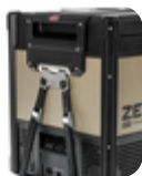
ARB* Kiinnityssarja sähkökäyttöisen ARB Zero -matkajääkaapin kiinnittämiseen