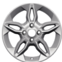
Jante en alliage 16" design à 5x2 branches, argent 6,5 x 16", déport 40, pour pneus 195/55R16