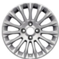
Jante en alliage 16" design à 15 branches, argent 6,5 x 16", déport 40, pour pneus 195/55R16