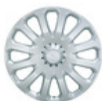
Enjoliveur 15" Enjoliveur vendu à l'unité