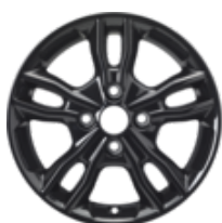
Jante en alliage 16" Modèle à 5 x 2 branches, Panther Black 6,5 x 16", déport 40, pour pneus 195/55 R16