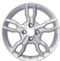
Jante en alliage 16" Design à 5 x 2 branches, argent 6,5 x 16", déport 40, pour pneus 195/55R16