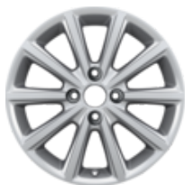
Jante en alliage 16" 10 branches, argent 6,5 x 16", déport 40, pour pneus 195/55 R16