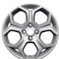
Jante en alliage 17" design à 5 branches en Y, argent 6.5 x 17", déport 40, pour pneus 205/45R17 – Uniquement en combinaison avec une butée de braquage