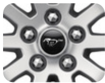
Capac central Logo Mustang