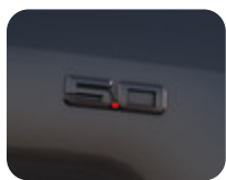
Emblemă 5.0 partea dreaptă, negru

Emblemă cu adeziv pentru fixarea pe aripa față