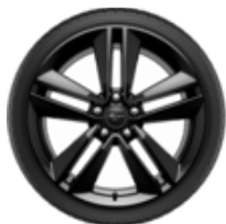
Roată completă de iarnă cu jantă din aliaj ușor 19" Design 5 x 2 spițe, Ebony Black

9J x 19 ET45, Nokian Snowproof 1, 255/40 R19 100V XL, etichetă pentru caracteristicile anvelopelor conform directivei UE nr. 2020/740 – Cu senzori de monitorizare a presiunii în anvelope. Compatibil cu lanțurile de zăpadă; compatibilitatea lanțurilor poate depinde de dimensiunile jantei.