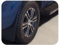
18" Alüminyum Alaşım Jant