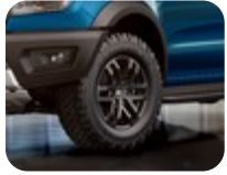
17" Alüminyum Alaşım Jant 6 x 2 Kollu Tasarım, Dyno Gri 8.5 x 17", ofset 55, 285/70 R17 lastikler için. – Raptor araçlar için.