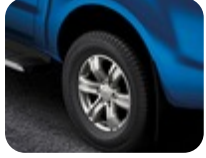
17" Alüminyum Alaşım Jant 6 Kollu Tasarım, Parlak Gümüş 8 x 17", ofset 55, 265/65 R17 lastikler için – Raptor hariç