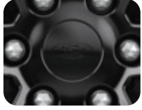
Jant Göbeği Ebony Siyahı