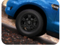
17" Alüminyum Alaşım Jant 6 Kollu Tasarım, Panter Siyah 8 x 17", ofset 55, 265/65 R17 lastikler için – Raptor hariç