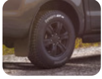
17" Alüminyum Alaşım Jant 6 kollu tasarım, Asfalt Siyahı 8 x 17", ofset 55, 265/65 R17 lastikler için