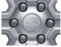
Jant Göbeği, Gümüş