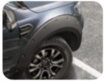
EGR* Dodik ön ve arka, krom civata kapaklı mat siyah

Tam 6 parça araç seti – Limited ve Wildtrack, yardımcı paralel parkı olan araçlar hariç