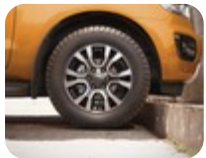
18" Alüminyum Alaşım Jant 6 kollu Y tasarımı, Orta Koyu Gri 8.0 x 18 ", ofset 55, 265/60 R18 lastikler için – Raptor hariç