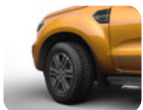
18" Alüminyum Alaşım Jant 6 x 2 kollu tasarım, Orta Koyu Gri 8 x 18 ", ofset 55, 265/60 R18 lastikler için