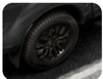
18" Alüminyum Alaşım Jant 6 x 2 kollu Y tasarım, siyah 8 x 18 ", ofset 55, 265/60 R18 lastikler için – Raptor hariç