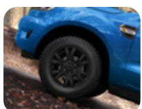
18" Alüminyum Alaşım Jant 6x2 Kollu tasarım, Panter Siyah 8 x 18", ofset 55, 265/60 R18 lastikler için